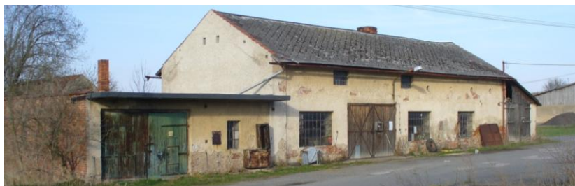
Zde stával obecní dům pro chudinu (č.p. 108)