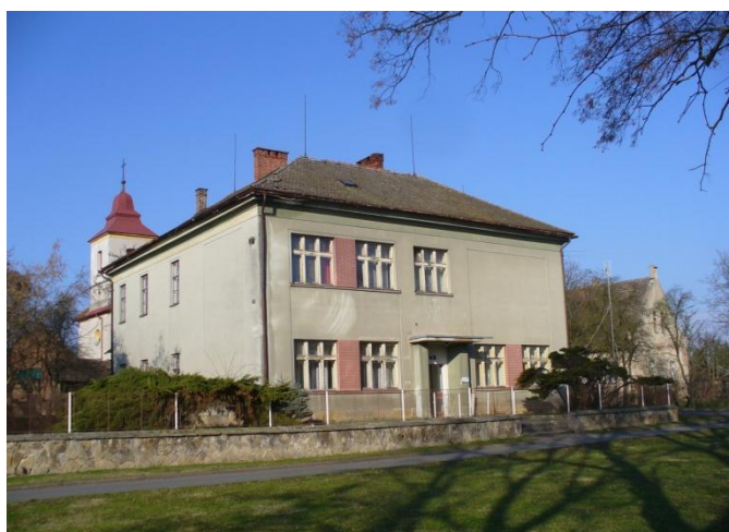
Škola v současné době