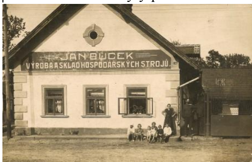
Strojírna ve Smidarech, r.1920