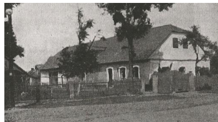
Rodný dům Josefa Hanuše

Narodil se 6.1.1876 v č.p. 112. Vystudoval gymnasium v Novém Bydžově roku 1886-87 a v Jičíně 1887-1894. V roce 1894 vstoupil do