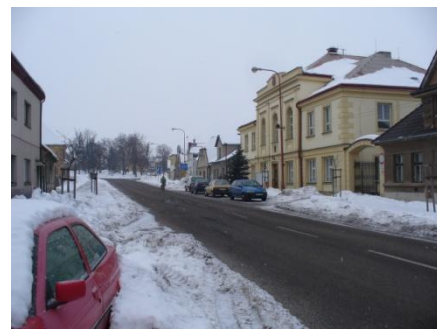
Smidary - náměstí a Obecní úřad